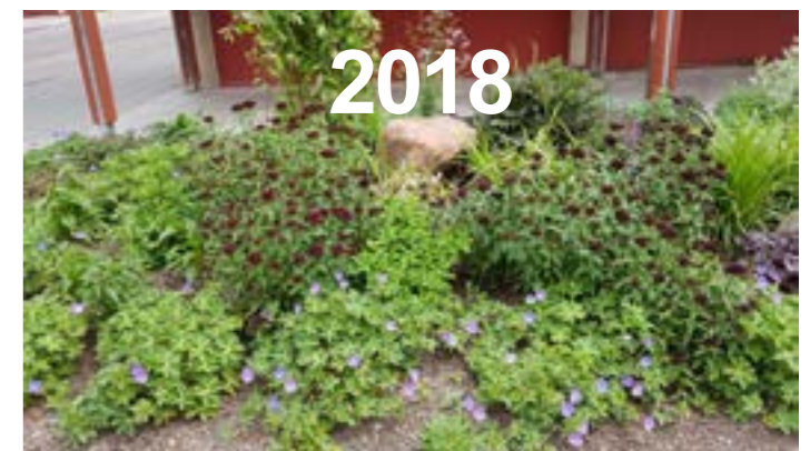
Exempel på rabatt som förnyades 2017, bild till höger är hur rabatten ser ut nu.